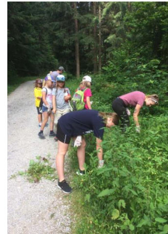
Abbildung 4: Mitglieder der JuBla bei der Bekämpfung des drüsigem Springkrauts

Nach dem erfolgreichen Infotag wurde ein kleiner Bericht im Gemeindeblatt darüber publiziert. Teil des Berichts waren auch Informationen aus dem erstellten Merkblatt zum drüsigem Springkraut: