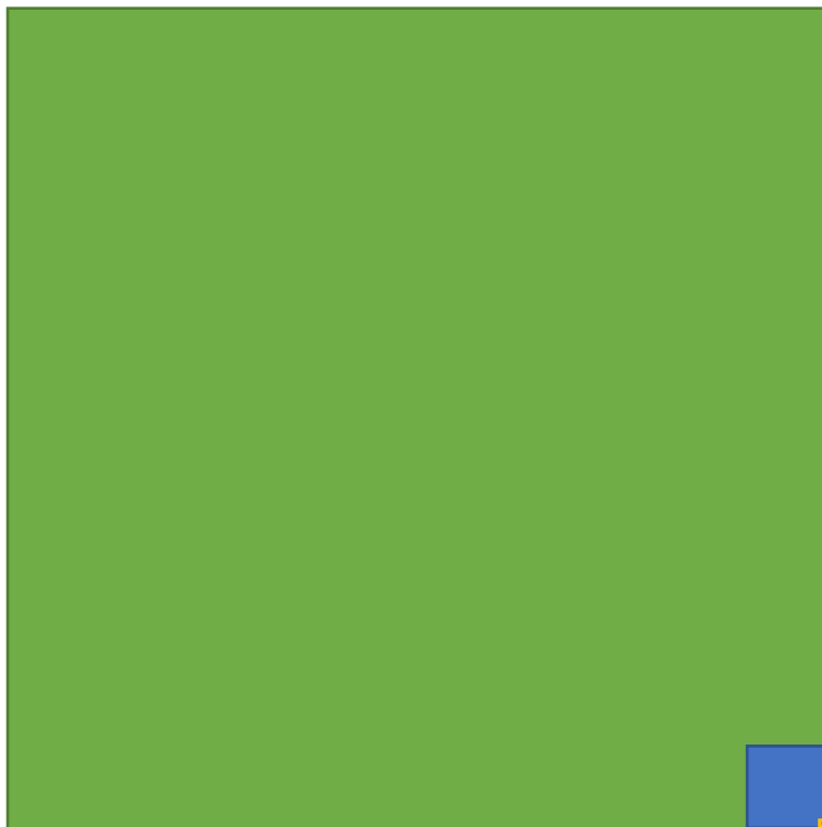
Abbildung 1 : Veranschaulichung der Zehnerregel von Williamson – Das Verhältnis zwischen Gebietsfremde Arten, welche importiert werden (Grün), davon 10% der Arten, welche verwildern (Blau), davon wiederum 10% der Arten, welche sich in der neuen Gegend etablieren (Gelb), und davon schlussendlich 10% der Arten, welche sich invasiv verhalten (Rot).

Nicht jede gebietsfremde Art ist automatisch eine invasive Art ist. Eine bekannte Faustregel besagt, dass von 1000 eingeführten Arten, nur 100 in der Natur verwildern, davon etablieren sich nur 10 und 1 davon hat ein invasiver Charakter (Williamson und Fitter 1996):