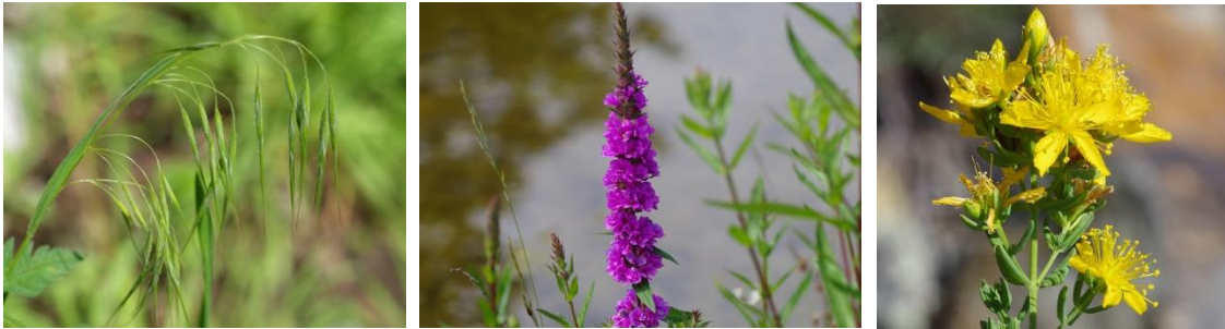
Abbildung 3: Von links nach rechts: Die Dach Trespe, der Blutweiderich und das Echte Johanniskraut – alle diese Pflanzen sind einheimische Schweizerpflanzen, welche auf anderen Kontinenten invasive Neophyten sind.