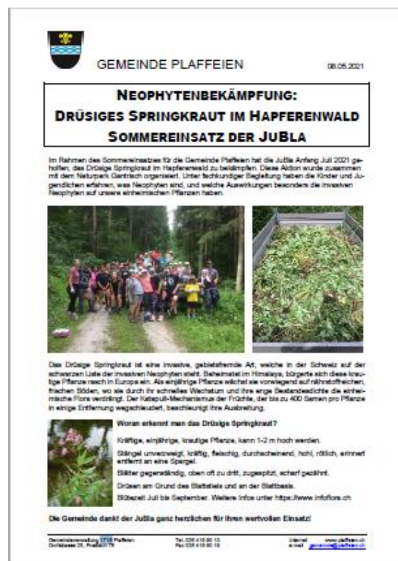
Abbildung 5: Bericht im Gemeindeblatt zum Aktionstag (Siehe Anhang)