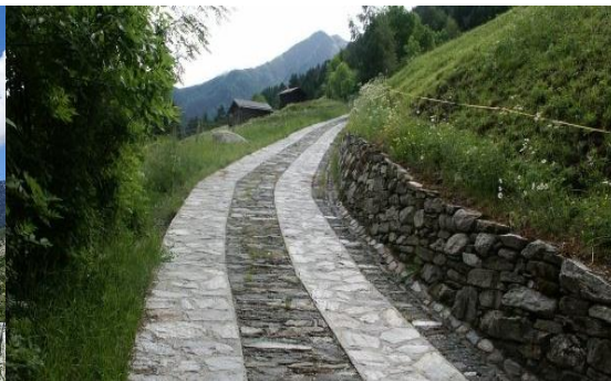
Weg nach Hockmatte