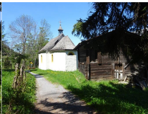
Kapelle «uff dum Blatt»