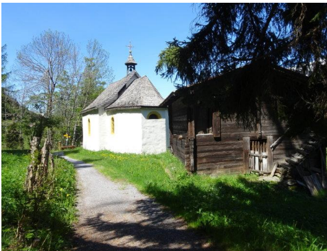
Kapelle "uf dum Blatt"