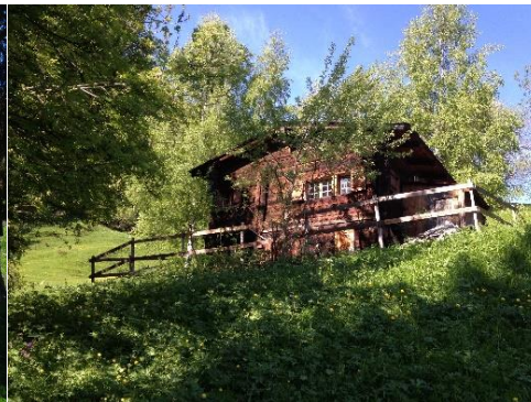
Apéro auf der Alp