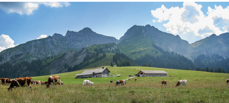
Le plateau de Pra Cornet, zone humide, pâturage et coup d'œil imprenable.

Buvette des Charmilles, Pra Cornet, 079 287 97 08 www.tipi-ranch-etivaz.ch