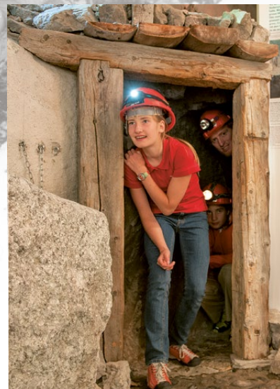
13 Kilometer Stollen am Mot Madlain (links) – und eine Rekonstruktion im Museum (rechts)